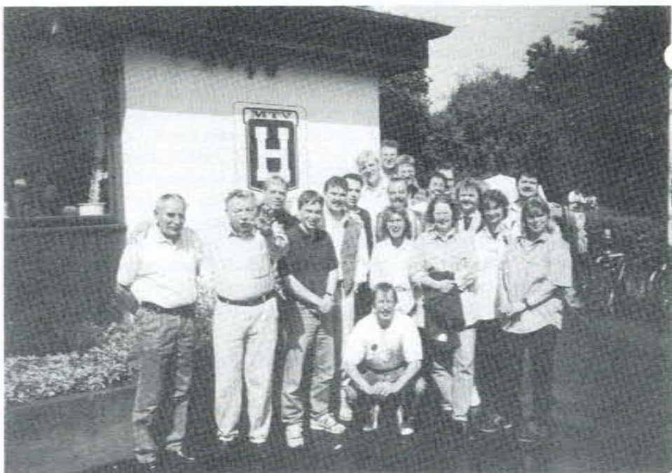
Die „Ehemaligen“ A-Jugend mit ihren damaligen Trainern

Alle Adressen zu bekommen, gestaltete sich sehr schwierig, da viele Ehemalige nicht mehr in und um Hannover wohnen. Trotz alledem kamen immerhin 28 „Ehemalige“.