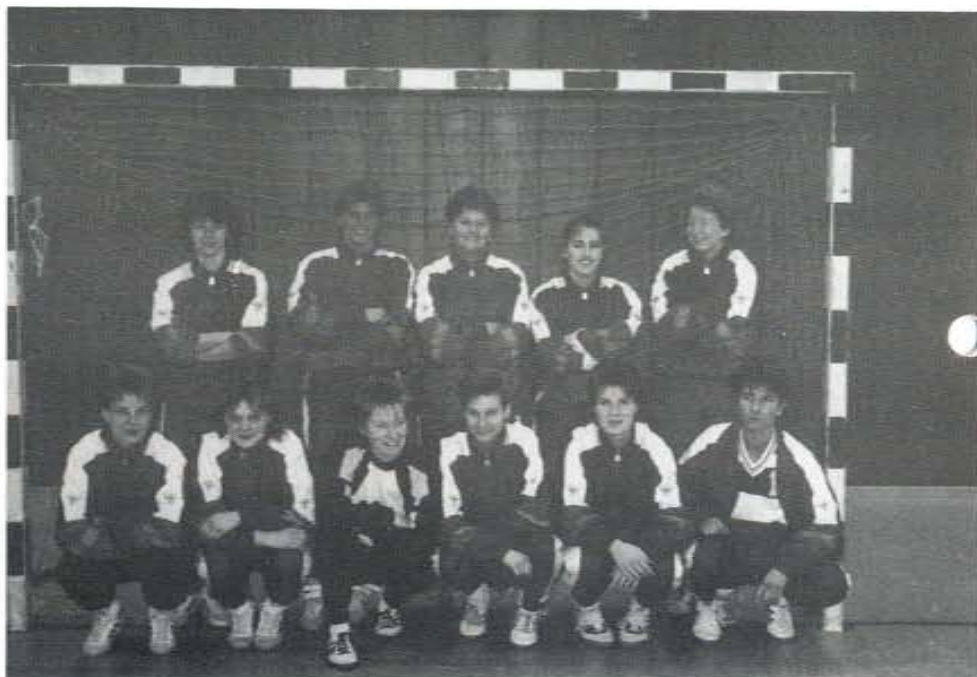
1. Damen MTV Herrenhausen